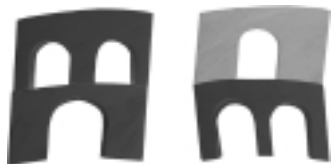
Dezelfde richting Verandering van richting

Nu wordt geprobeerd de toren zo hoog mogelijk te bouwen en deze af te maken met een daksteen. De daksteen mag pas op de toren worden gezet als je geen andere steen meer hebt.