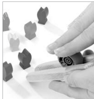
Knikkeren met de knikkerslak met behulp van de baan

Er wordt om de beurt gespeeld. Diegene van jullie die het laatst sla heeft gegeven, mag beginnen en pakt de knikkerbaan. Zet de knikkerbaan vóór je neer, zodat de opening naar het speelveld toe staat. Zet dan de slak achterop de baan en duw deze vol energie met de wijsvinger naar buiten of laat hem